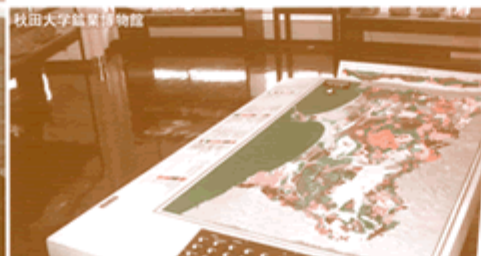
秋田大学鉱業博物館

東京からのアクセス 秋田へは……飛行機か秋田新幹線まで (飛行機)秋田空港からエアポートライナー (直通タクシー 018-867-7444)で ☆秋田駅まで約50分(片道1,300円) (J R)秋田駅から (秋田駅予約センター 050-2016-1600) ☆秋田新幹線まで秋田駅まで約4時間 (片道16,470円) ※繁忙期、閑散期で若干異なります。