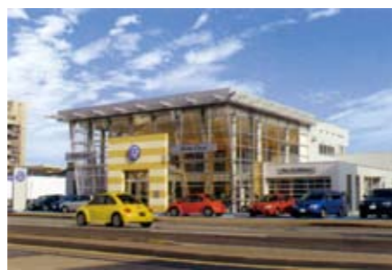
DUO秋田 フォルクスワーゲンブランドの販売を行っている。