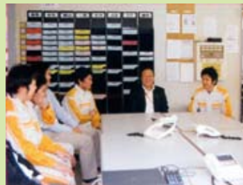
全県に広がっているスタッフの「生の声」、「言葉の温度」を感じるため、社長自らも年間60数回におよぶオフサイトミーティングに参加しています。