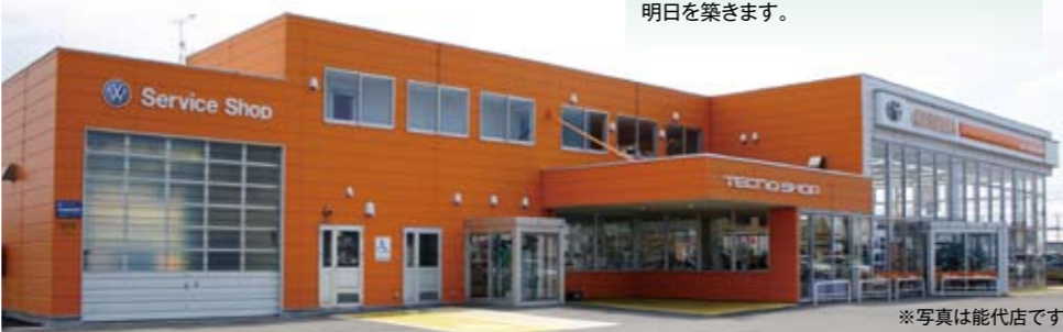
※写真は能代店です。