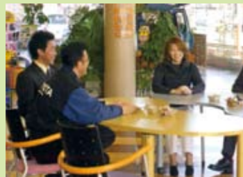
お客様が「また来たい」お店づくりをめざした本社ショールーム。

本社／秋田市寺内字神屋敷295-37 TEL 018-880-1500(代) FAX 018-862-8965 URL http://toyota.medialogy.ne.jp/corolla/C079/kaisya/index.html