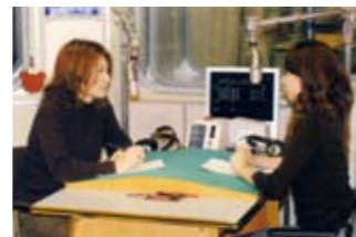
エフエム秋田で放送中の「はい、カローラおはこです。」四季折々の秋田の空気や、店舗情報などを声の絵巻で発信中!

事業所／本社秋田市 T-UPニュートン：車買取専門店 ケータイSHOP ピッピ：携帯電話取扱 営業所／秋田市内6店舗、秋田市外10店舗、ほかマイカーセンター2店舗 グループ会社／○DUO秋田株式会社：Volkswagen車種取扱 ○株式会社シーエコーポレーション：車種リース・車種リペア ○シーエーカークラブ：BP事業部 ○株式会社ティーシーエー：不動産事業 ○株式会社セスタ秋田：介護用品取扱 ○株式会社Seeds：広告代理店業務