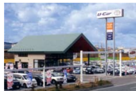
本社カローラプラザ 本社に隣接する、中古車販売部門の中心的存在。県内最大規模の250台の展示スペース。