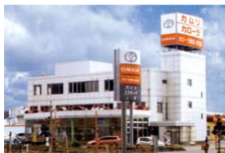
トヨタカローラ秋田 トヨタカローラ秋田グループの核ともいえる。新車・中古車の販売を行う。

「Let's find it! 気付こう日々の仕事にテーマは眠っている」を合言葉に、「気楽に真面目な話」を「本音」で語る オフサイトミーティング に重点をおき、全県に広がっているスタッフの「生の声」を取入れ、改革、改善を続けながら、トヨタカローラ秋田グループ全体の成長を目指しています。