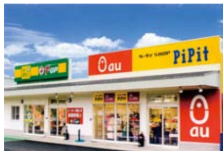
車買取専門店「T-UPニュートン」 ケータイSHOP「ピッピ」